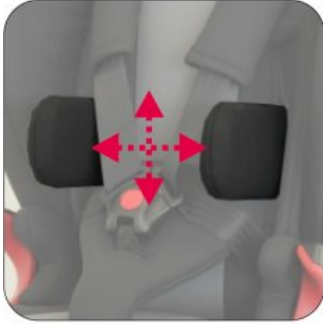
Suports de tronc ajustables Ipai-NXT