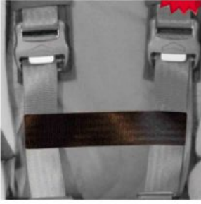
Cinturó conexió cinxes pit Hernik