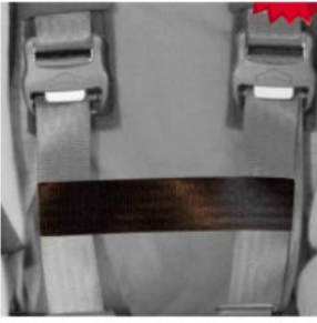
Cinturó conexió cinxes pit Hernik