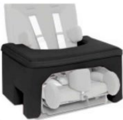
Taula de seguretat Ipai-Nxt