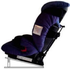
Base ajustable en inclinació Ipai-Nxt