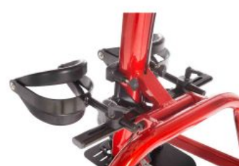
Suports de genoll Tim