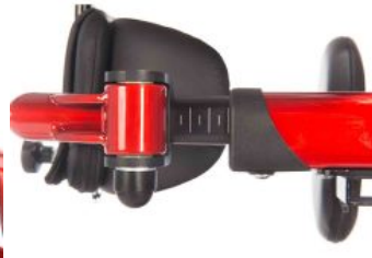
Suport combinat espatlla pelvis Tim