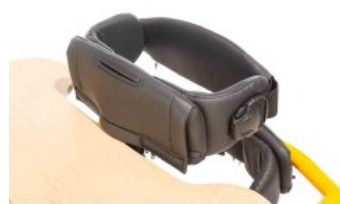
Suport de pit Tim