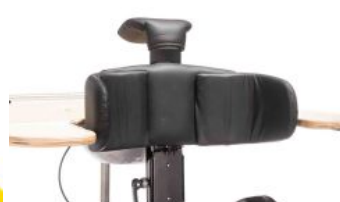
Coixinet mentó Tim