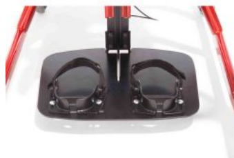
Cinxes de turmell Tim