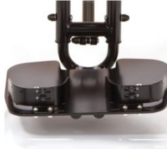
Soporte de talón para reposapiés Todd