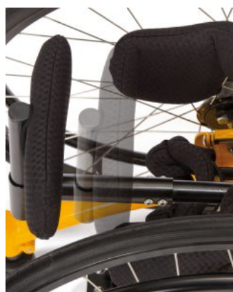
Soporte de glúteos Todd