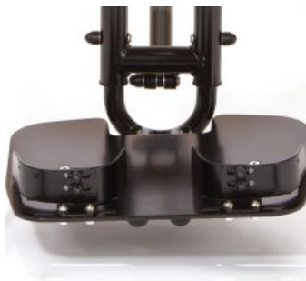
Sostene de talón para reposapiés Todd