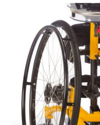
Ruedas motrices Todd