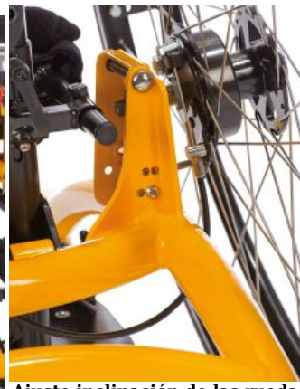
Ajuste inclinación de las ruedas Todd