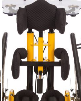
Soporte de pelvis y cadera ajustables Todd