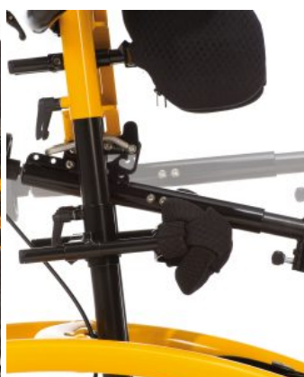
Mecanismo de plegado para soporte de glúteos Todd