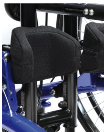
Soporte de rodilla Todd