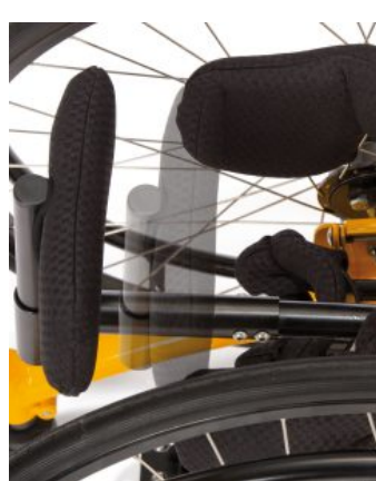
Soporte de glúteos Todd