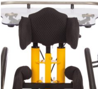
Mesa terapéutica Todd