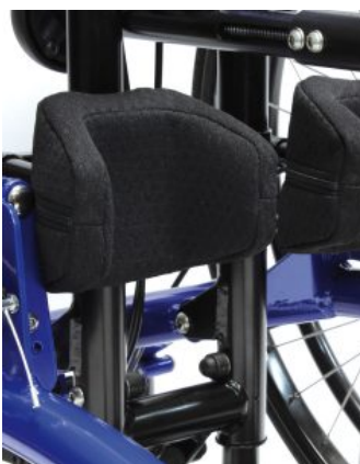
Soporte de rodilla Todd