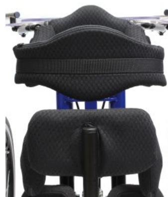
Cincha ancha sostene de espalda Todd