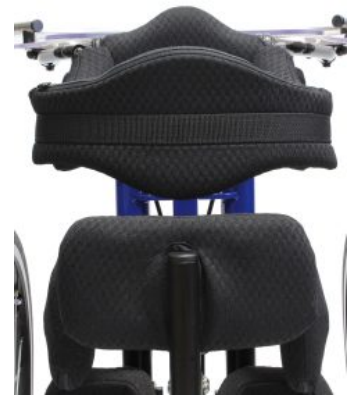
Cincha ancha soporte de espalda Todd