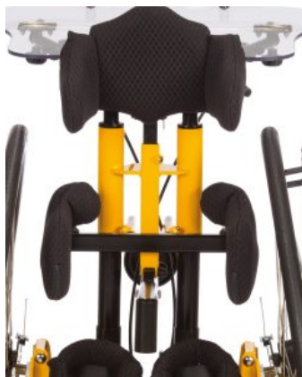
Sostene de pelvis y cadera ajustables Todd