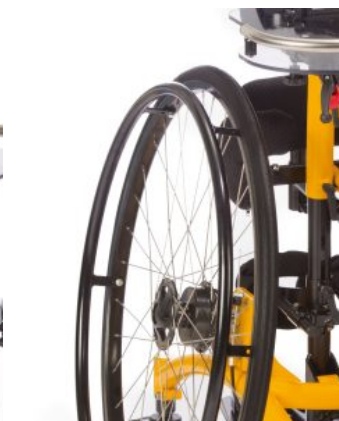
Ruedas motrices Todd