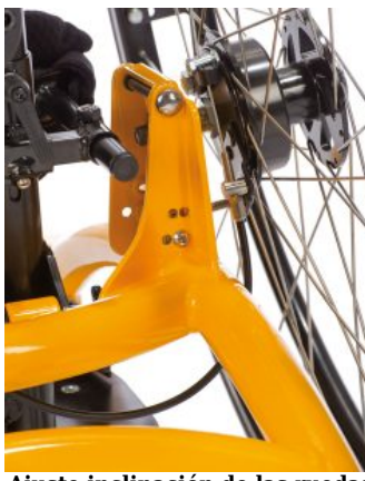
Ajuste inclinación de las ruedas Todd