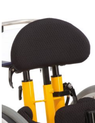
Sostene de pecho Todd