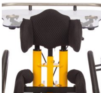
Mesa terapéutica Todd