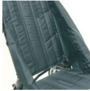
Tapissat nylon gris