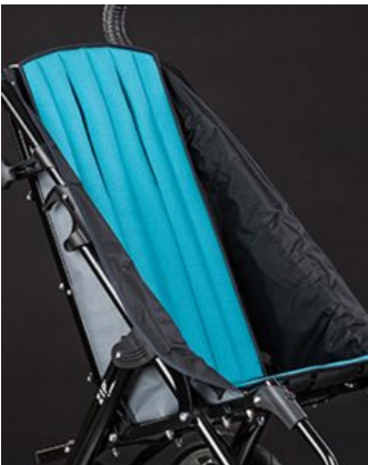
Tapissat respatller confort Zip