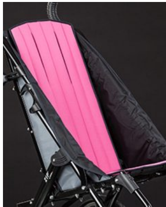
Tapissat seient confort Zip