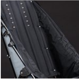
Tapissat nylon negre