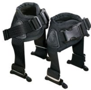
Cinxes de turmell Ankle Huggers Bodypoint