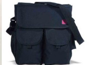
Bolso color negro Zip