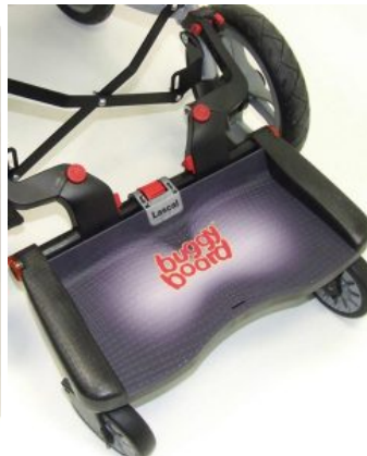
Buggy Board Zip