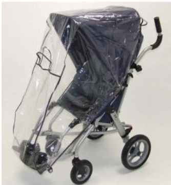
Capota con capa impermeable Zip