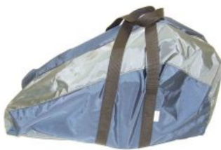
Bolsa transporte Zip