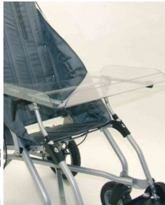
Mesa terapéutica Zip