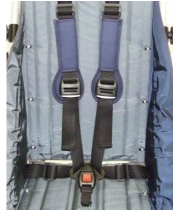
Cinturón 5 puntos Zip