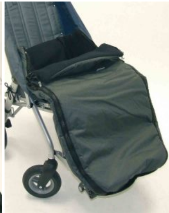
Saco de invierno Zip