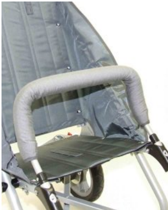
Barra delantera con funda Zip