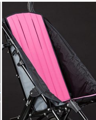
Tapizado asiento confort Zip