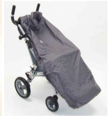
Capa de impermeable Zip