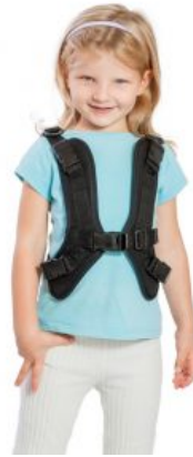
Arnés forma H Jumbo