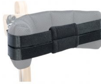
Cincha fijación Cabeza Jumbo