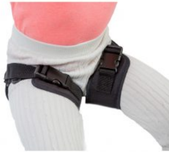
Cinturón de abducción de piernas Jumbo