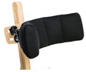
Reposacabezas ajustable Jumbo