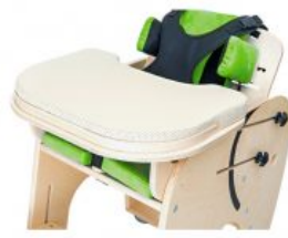
Funda para bandeja Jumbo