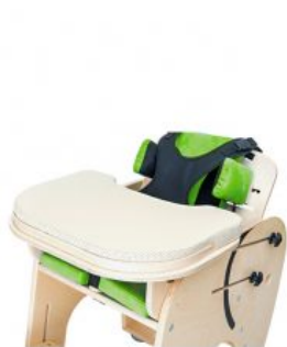
Funda safata Zebra