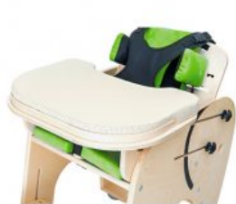
Funda safata Zebra