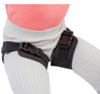
Cinturó d'abducció de cames Zebra