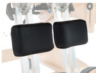
Encoixinat suport cames Zebra