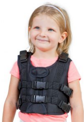
Armillà 6 punts Zebra