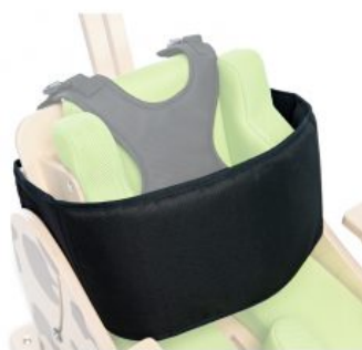
Cinturó tronc Zebra