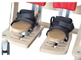
Reposapeus ajustable 3D Zebra