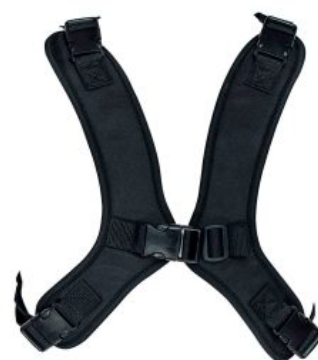
Arnès en forma H Zebra