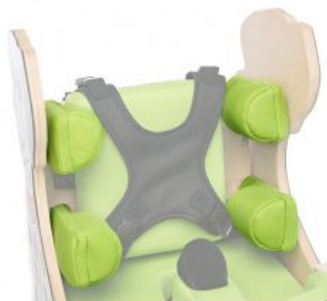
Controls laterals ajustables Zebra