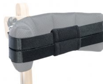
Cinturó subjecció de cap Zebra