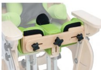
Suport genolls Zebra