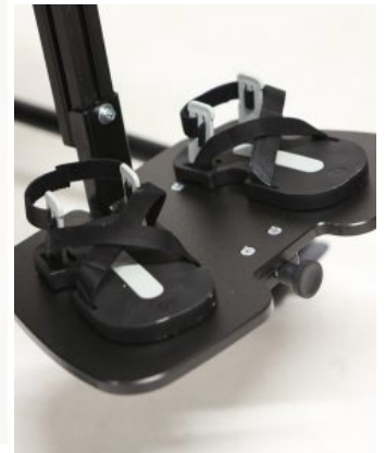
Sandalias (PAR) Jenx