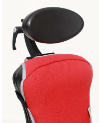
Reposacabezas oval Junior / Multiseat