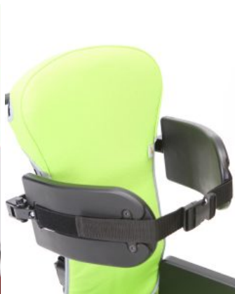
Soportes torácicos Multiseat