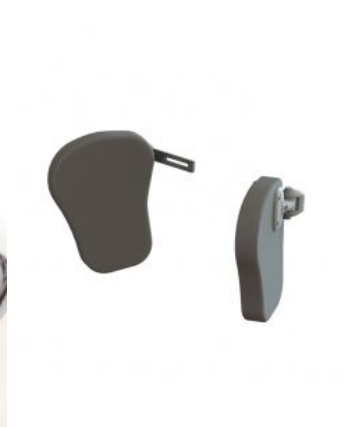
Soportes de hombro Jenx