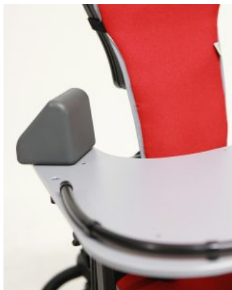
Bloques para codos (PAR) Junior / multiseat