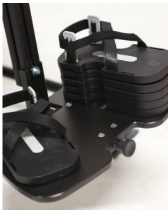
Bloques para sandalias Jenx