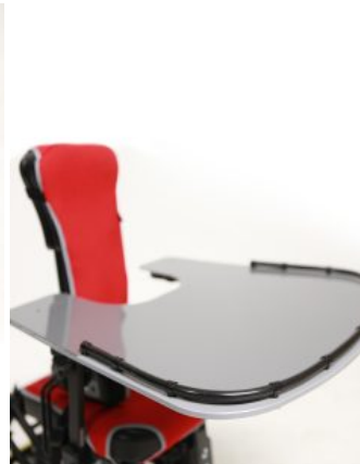
Mesa Junior+ / Multiseat