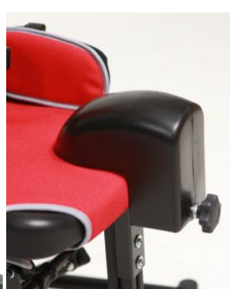
Taco abductor Jenx