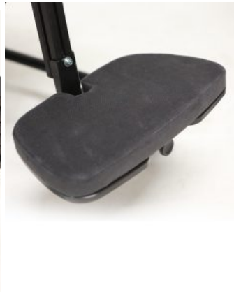
Plataforma reposapiés acolchada Multiseat