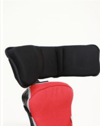
Reposacabezas multiajustable Junior+ / multiseat