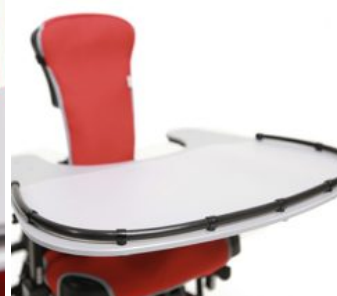
Reductor escotadura taula Junior