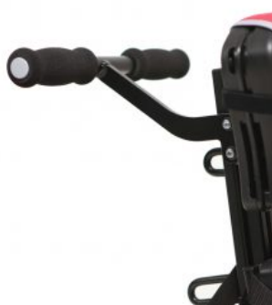
Empunyadures Junior +