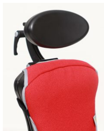
Reposacaps oval Junior / Multiseat