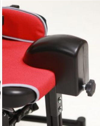
Tac abductor Jenx