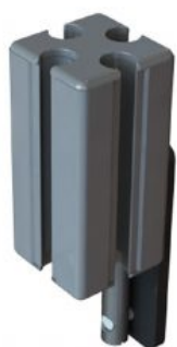
Extensió alçada respallier Junior+