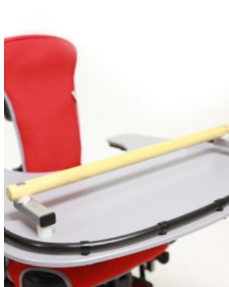
Barra per agafar-se Jenx