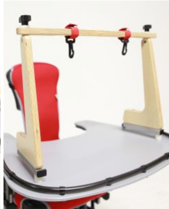
Arc per a jocs Jenx