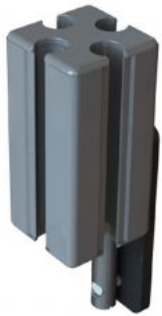
Extensió alçada respallier Junior+