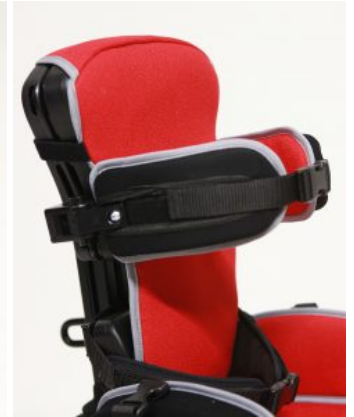
Soportes torácicos Junior+