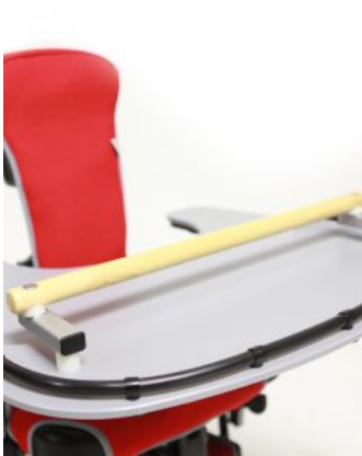
Barra de agarre Jenx