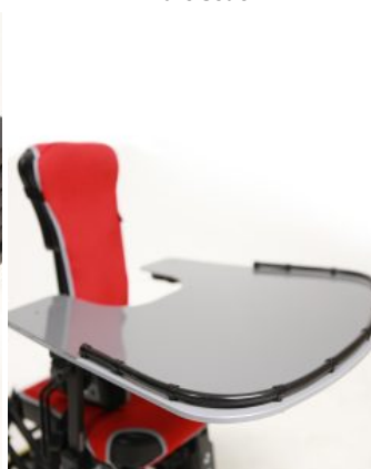
Mesa Junior+ / Multiseat