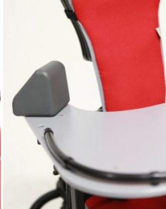
Bloques para codos (PAR) Junior / multiseat