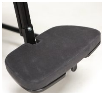
Plataforma reposapiés acolchada Junior+