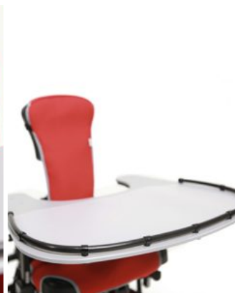
Bandeja de recorte reducida Junior