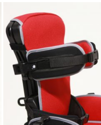
Soportes torácicos Junior+