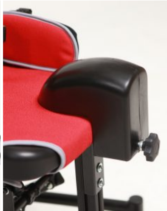
Taco abductor Jenx