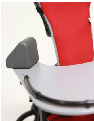
Bloques para codos (PAR) Junior / multiseat