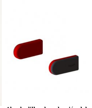
Almohadillas de reducción del ancho de cadera Junior+