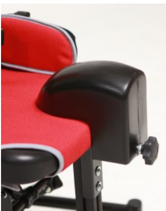
Taco abductor Jenx