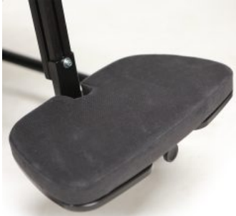
Plataforma reposapiés acolchada Junior+