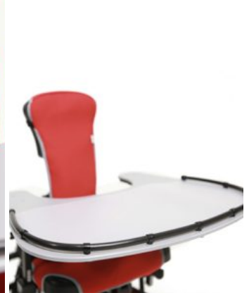
Bandeja de recorte reducida Junior