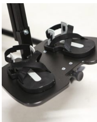
Sandalias (PAR) Jenx