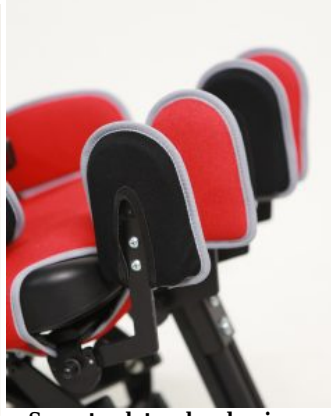
Soportes laterales de pierna (PAR) Junior+