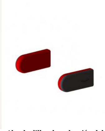
Almohadillas de reducción del ancho de cadera Junior+