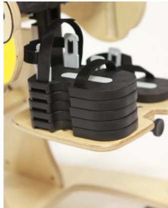
Bloques para sandalias Bee