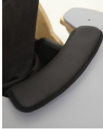
Relleno mesa Bee