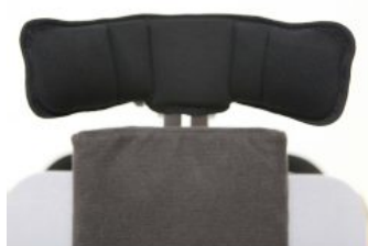
Reposacabezas multiajustable Bee