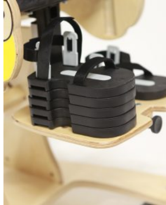
Bloques para sandalias Bee