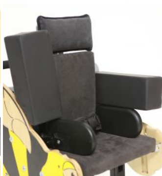
Bloques de espuma (PAR) Bee