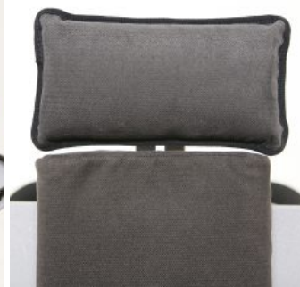
Soporte de cabeza plano Bee