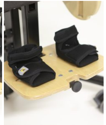
Botinas (PAR) Bee