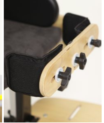
Soportes de rodilla Bee