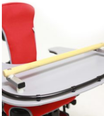
Barra de agarre Jenx