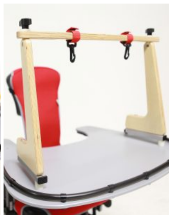
Arco para juegos Jenx