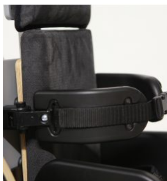
Soportes torácicos Jenx