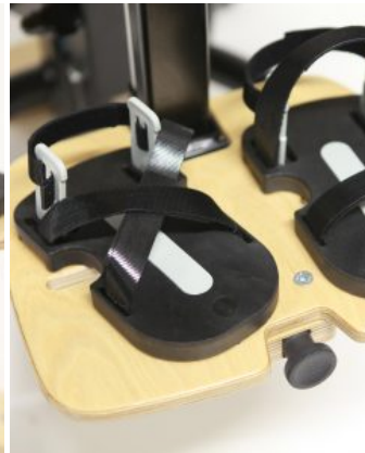
Sandalias (PAR) Bee