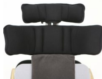
Soportes de hombro Bee