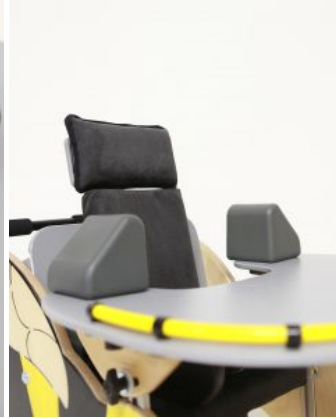
Bloques para codos (PAR) Jenx