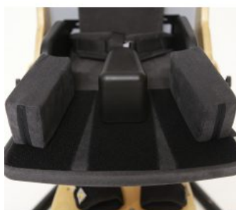
Prolongador de asiento Bee