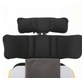
Soportes de hombro Bee