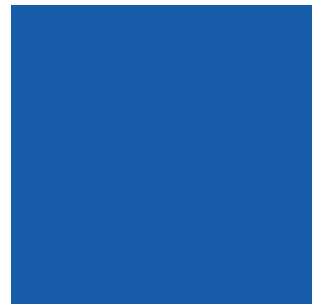
Blau (talla 2, 3 i 4)