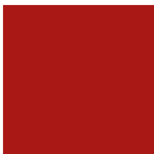
rojo (talla 2 y 3)