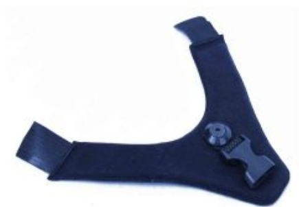
Cincha fijación Capovario