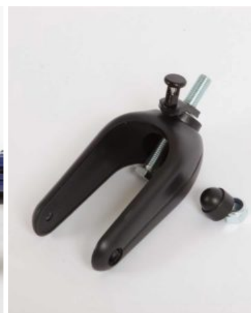
Bloquejador de direcció Meywalk 2000