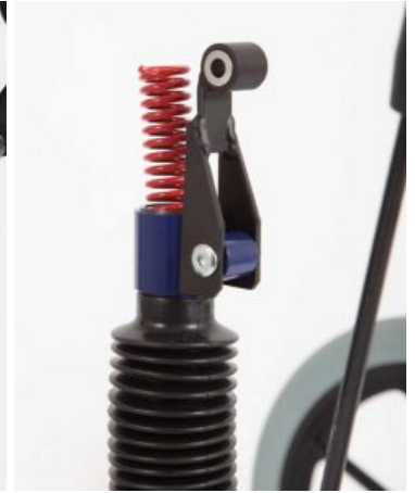
Ajustos de reducció d'altura (-8cm) (parell) Meywalk 2000