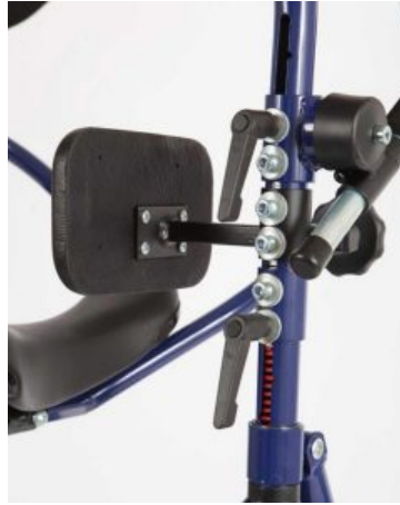
Encoixinats de maluc (parell) Meywalk 2000