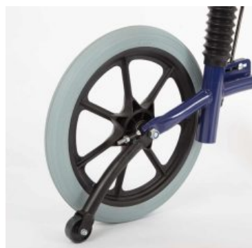
Antivolc (parell) Meywalk 2000