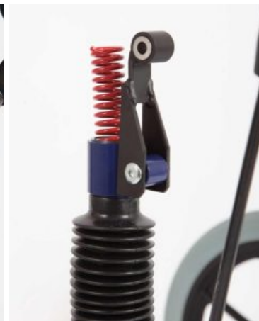
Ajustos de reducció d'altura (-8cm) (parell) Meywalk 2000