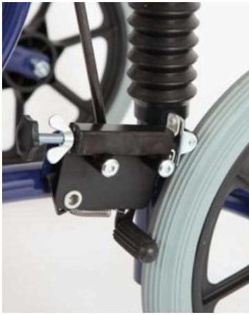
Freno Meywalk 2000