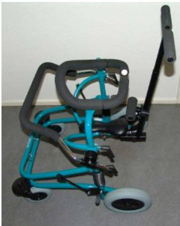
Barra de empuje Meywalk 2000 y Miniwalk