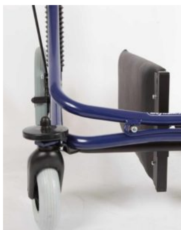
Divisoria de piernas Meywalk 2000