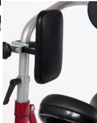
Soportes de cadera Meywalk 4