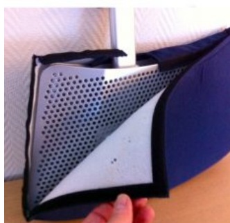
Funda para Divisoria de piernas Meywalk 4