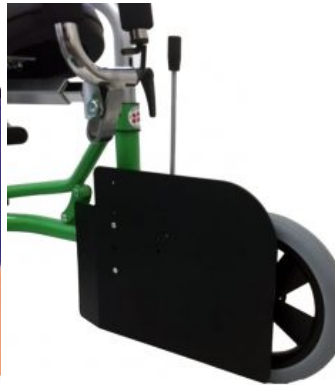
Guías de piernas (par) Meywalk 4