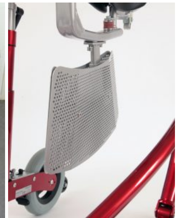
Divisoria de piernas Meywalk 4