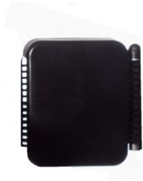
Bloque extra para Soporte de Tronco Meywalk 4