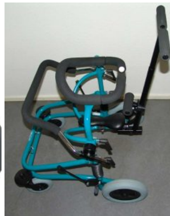
Barra de empuje Meywalk 4