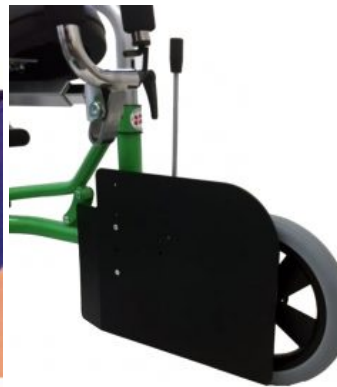
Guías de piernas (par) Meywalk 4