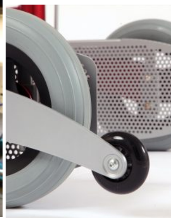
Antivuelco Meywalk 4