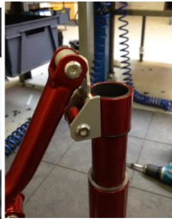
Ajustes de reducción de altura Meywalk 4