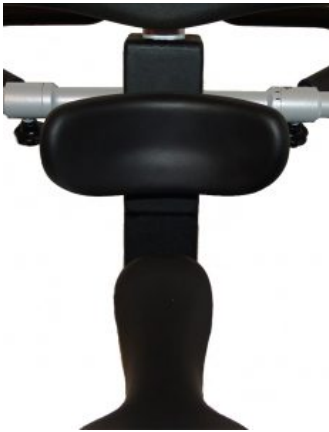
Amohadilla extra de soporte Meywalk 4