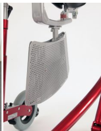
Divisoria de piernas Meywalk 4