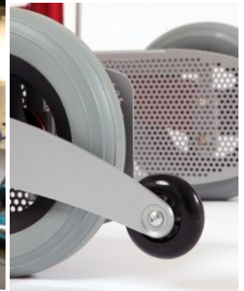
Antivuelco Meywalk 4