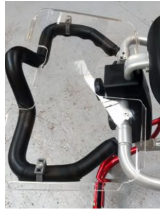
Bandeja Meywalk 4