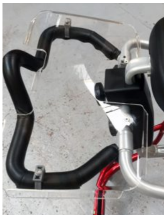
Bandeja Meywalk 4