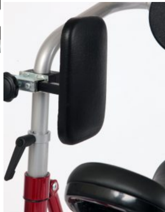
Soportes de cadera Meywalk 4