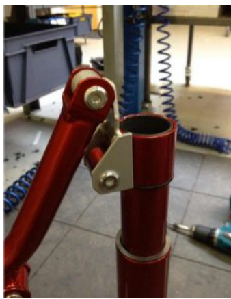
Ajustes de reducción de altura Meywalk 4