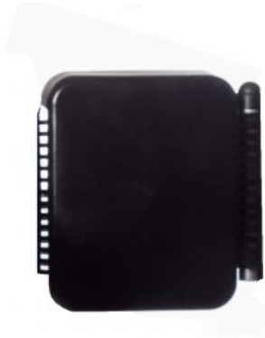
Bloque extra para Soporte de Tronco Meywalk 4