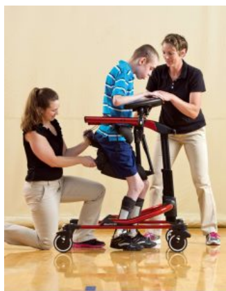
Bases Pacer Dinámico