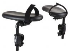
Reposabrazos planos Pacer