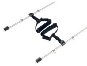
Conjunto soporte de tobillos Pacer