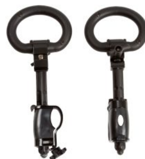
Apoyo manos cerrado Pacer