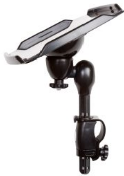
Mesa para comunicador Pacer