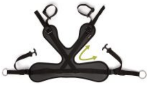
Soporte pélvico Pacer