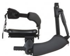
Sillín multiposicionador Pacer Dinámico