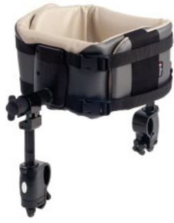
Soporte de tronco Pacer