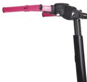
Chasis superior Pacer Dinámico