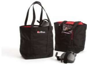
Bolsa Pacer y E-Pacer