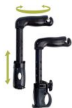
Empuñaduras extras Pacer