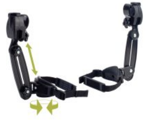
Soporte de muslo Pacer