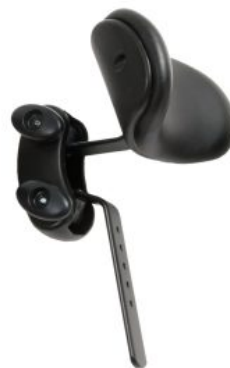
Reposacabezas curvo Activity Chair