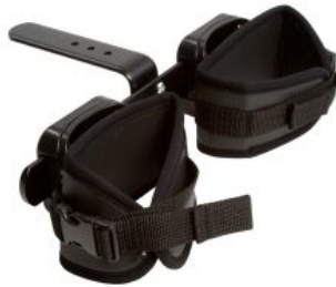
Soporte de piernas Activity Chair