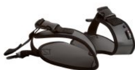
Arnés de piernas Activity Chair