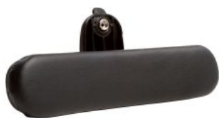
Pad respaldo acolchado Activity Chair