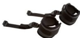
Bandas de tobillo Activity Chair