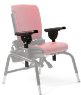
Reposabrazos Activity Chair