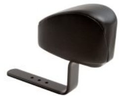
Taco abductor Activity Chair