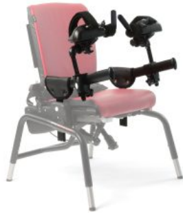
Soporte de antebrazo Activity Chair