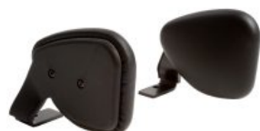
Par de aductores Activity Chair