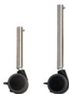
Conjunto patas largas con ruedas Activity Chair