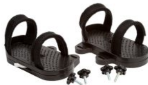
Par de sandalias Activity Chair