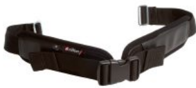
Cinturón de piernas Activity chair