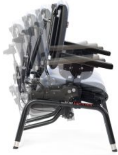
Asiento con basculación dinámico Activity chair