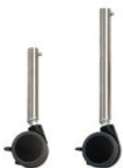
Conjunto patas cortas con ruedas Activity Chair