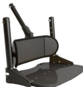
Reposapiés Activity Chair