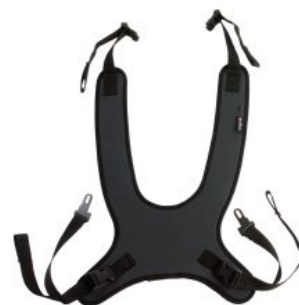
Arnés mariposa Activity Chair