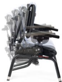
Asiento con basculación dinámico Activity chair