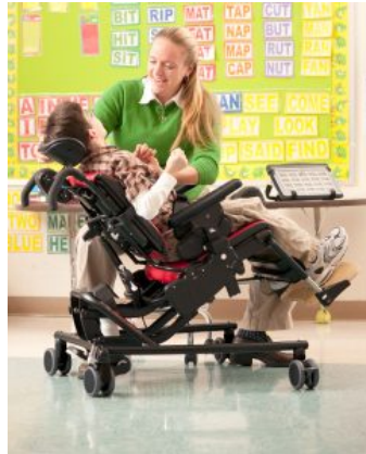
Asiento con basculación Activity Chair