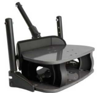
Elevador de pies Activity Chair