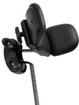
Reposacabezas con alas ajustable Activity Chair