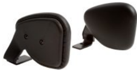
Par de aductores Activity Chair