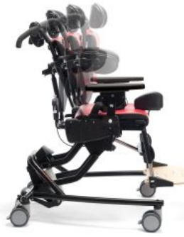
Respaldo ajustable Activity Chair