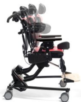
Respaldo ajustable Activity Chair