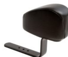
Taco abductor Activity Chair