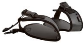
Arnés de piernas Activity Chair