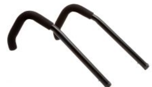
Empuñadura Activity Chair