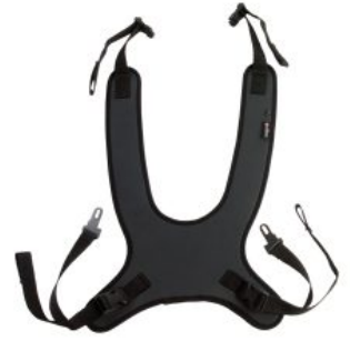
Arnés mariposa Activity Chair