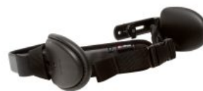
Cincha de pecho Activity Chair