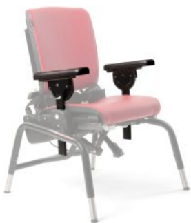
Reposabrazos Activity Chair