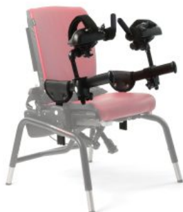
Soporte de antebrazo Activity Chair