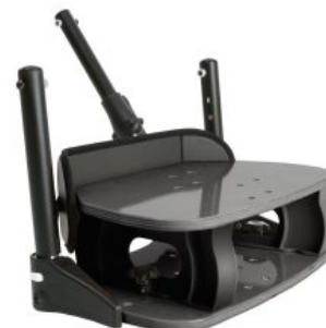
Elevador de pies Activity Chair