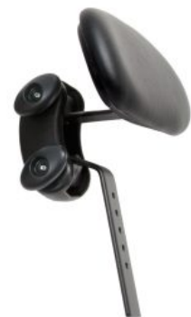
Reposacabezas plano Activity Chair