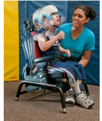
Respaldo dinámico Activity Chair