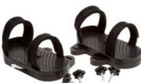
Par de sandalias Activity Chair