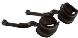
Bandas de tobillo Activity Chair