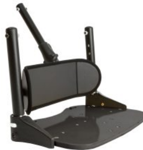
Reposapiés Activity Chair