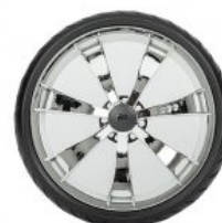
LLantas cromadas Flux