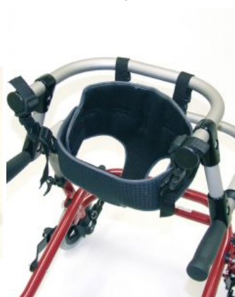
Barra soporte para sustentador pélvico Flux