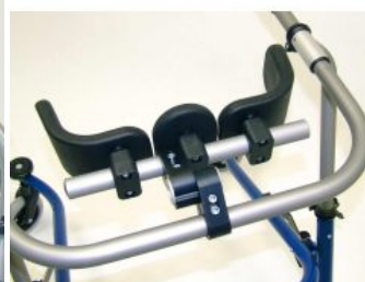
Soporte de cadera ajustable Flux