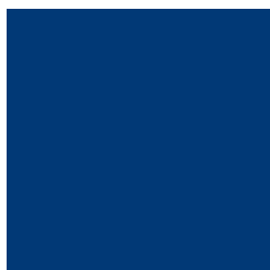
Azul oscuro (Talla 2)