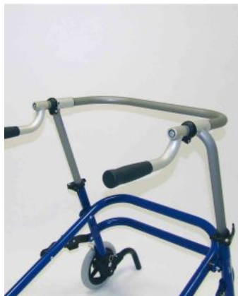
Barra con empuñaduras ajustables en rotación Flux