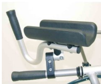
Soporte de antebrazo Flux