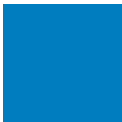
Azul claro (Talla 3)