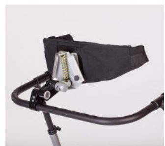
Control de cadera dinámico con cinturón Flux