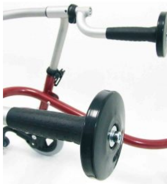
Tope tipo disco para empuñadura Flux