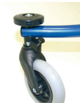
Ruedas parachoques Flux