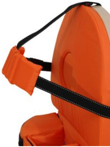
Cincha fijación cabeza Cat 2