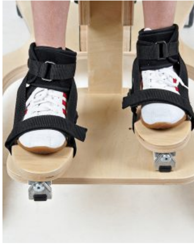
Reposapiés direccionables con cinchas 3D Cat 2