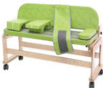
Cinchas Banco decúbito lateral