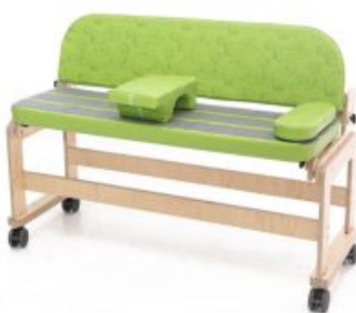
cojines de soporte Banco decúbito lateral