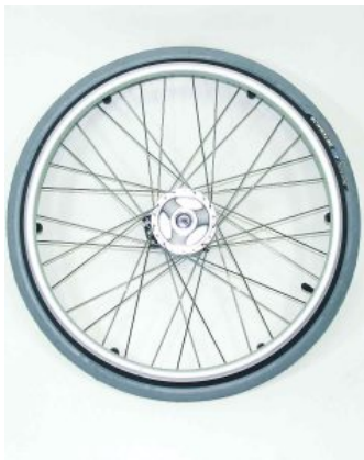
Rueda trasera Supra