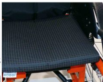
Cojín de asiento Supra