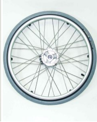
Rueda trasera Supra