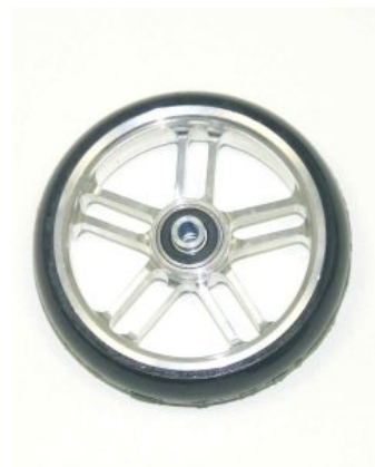
Ruedas delanteras Supra