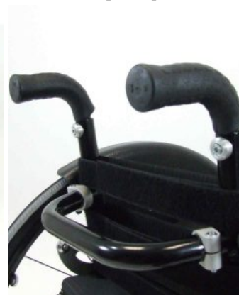
Empuñaduras y barra de empuje Supra