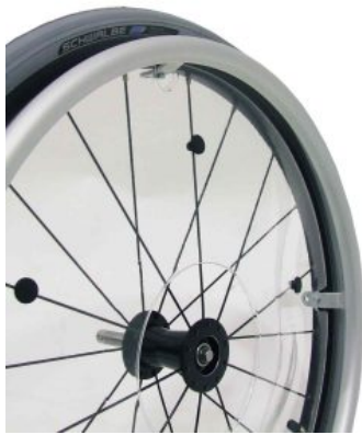
Protectores de radio Supra