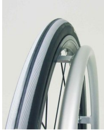
Aros de propulsión Supra