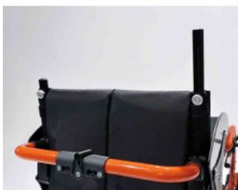
Tapizado de respaldo Supra