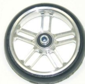
Ruedas delanteras Supra