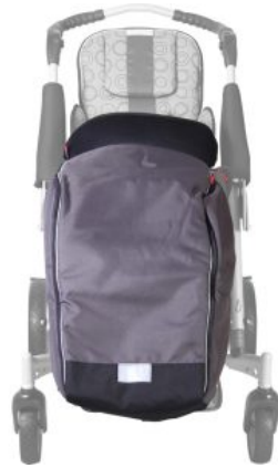
Saco de invierno Tom5