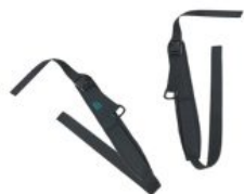
Arnés de piernas Bodypoint