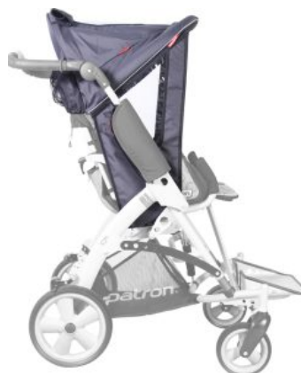
Capota estándar Tom5