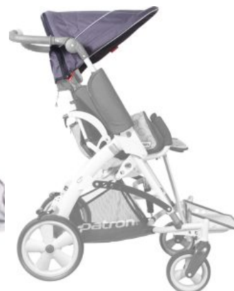
Capota para el sol Tom5