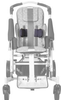
Soportes laterales de tronco (PAR) TOM5