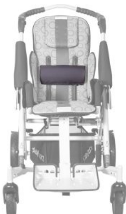
Soporte lumbar Tom5