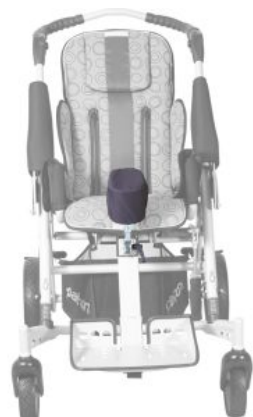
Separador de piernas Tom5