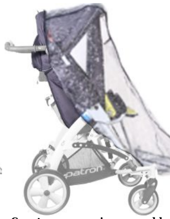
Capota con capa impermeable Tom5