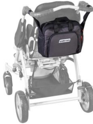
Bolso Activ Tom5