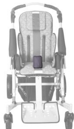
Taco abductor Tom5