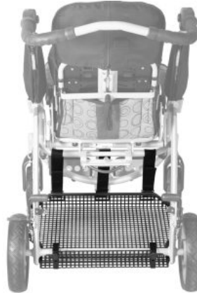
Cesta metálica Tom5