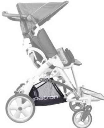
Cesta hd (alta densidad) Tom5