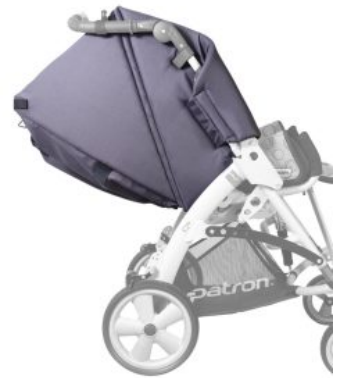
Extensión protector lateral Tom5