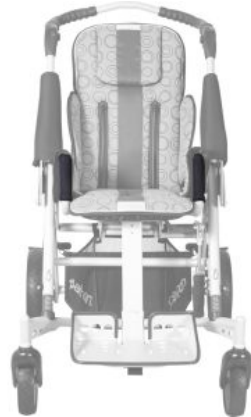
Protector soporte barra Tom5