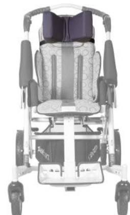
Reposacabezas en forma de «U» Tom5