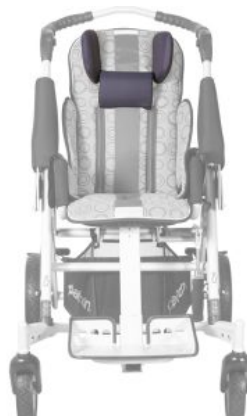
Soporte nuca Tom5