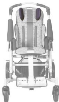
Soportes para la cabeza ( PAR) Tom5