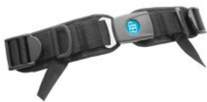
Cinturón pélvico 4 puntos Bodypoint