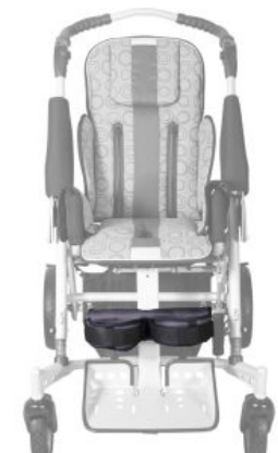
Soporte de piernas con fijación Tom5