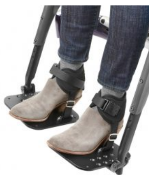
Cinchas de tobillo Ankle Huggers Bodypoint