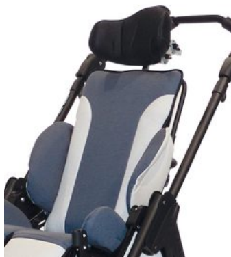
Reposacabezas ajustable Bingo OT