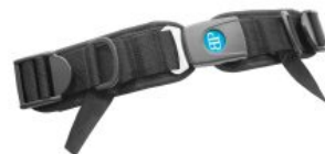
Cinturón pélvico 4 puntos Bodypoint