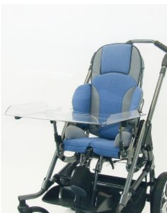
Mesa terapéutica Hoggi