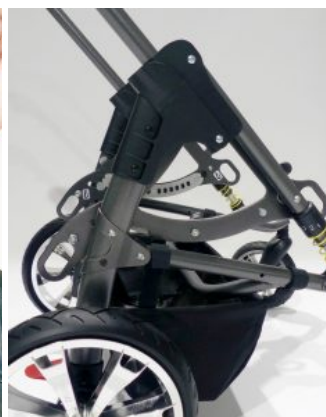
Kit anclaje para vehículo Bingo/Bingo OT