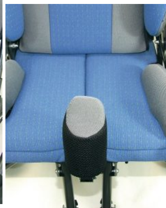
Taco abductor Hoggi