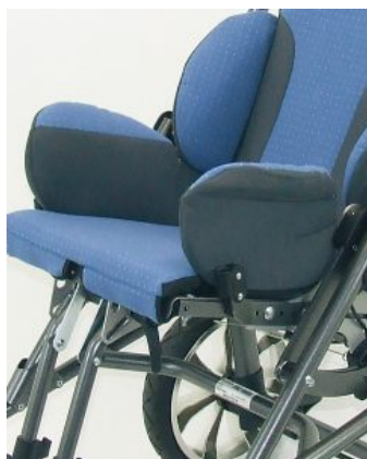
Soportes pélvicos ajustables Bingo/Bingo OT