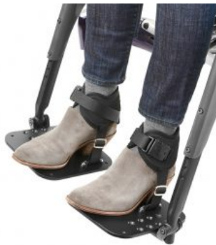
Cinchas de tobillo Ankle Huggers Bodypoint