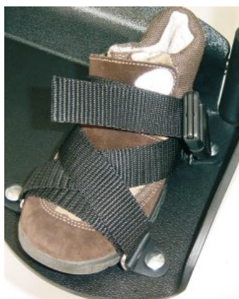
Cincha para pies (PAR) Hoggi