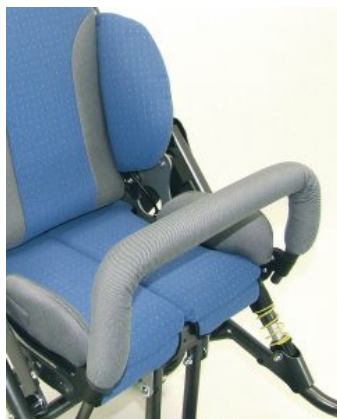
Barra delantera con funda Hoggi