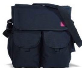
Bolso color negro Hoggi