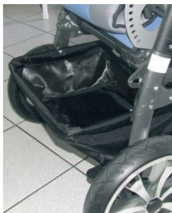
Cesta hasta 8 kg Bingo/Bingo OT