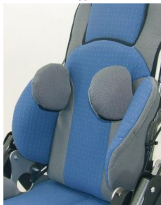
Soportes de tronco ajustables Hoggi