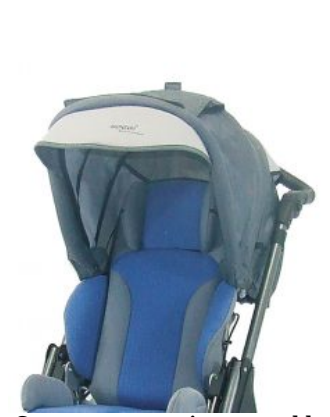
Capota con capa impermeable Hoggi