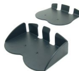
Bloqueo plataforma reposapiés Bingo/Bingo OT