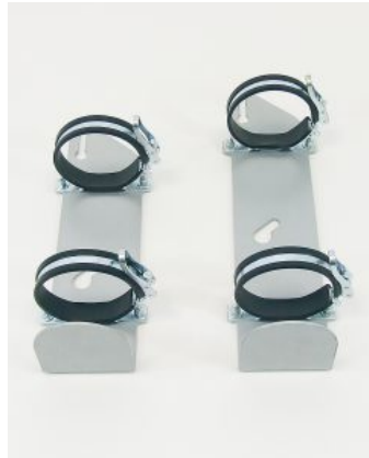
Soporte de oxígeno para botellas Bingo/Bingo OT