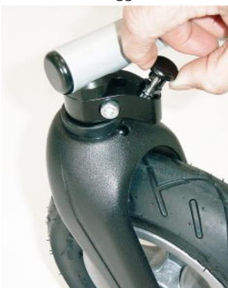
Bloqueo de dirección Bingo/Bingo OT