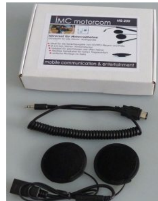
Altavoces para soporte de cabeza Hoggi