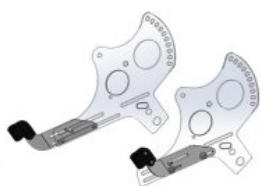
Soporte para barra o mesa terapéutica Hoggi