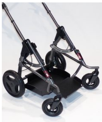
Ruedas PU Bingo / Binto OT