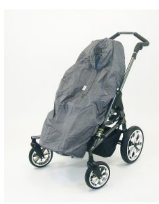
Capa impermeable Hoggi