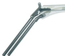
Reposapiés elevables Bingo/Bingo OT