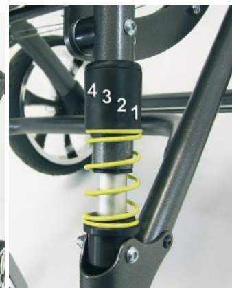
Suspensión ajustable en 4 puntos Bingo / Bingo OT