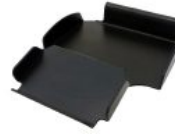
Bandeja para respirador Bingo/Bingo OT