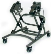
Chasis de interior Cobra para Bingo/Bingo OT