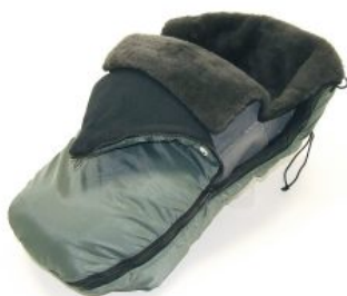
Saco para invierno Hoggi