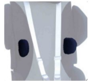
Soportes de tronco Kidsflex