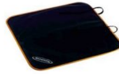
Protector asiento de coche Hernik