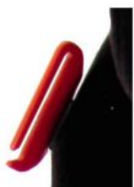
Guía de cinturón adicional Kidsflex