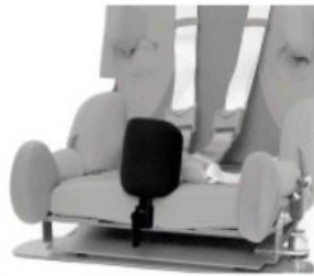
Taco abductor extraíble Kidsflex