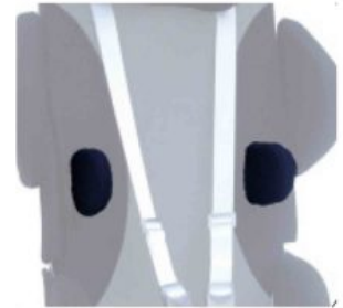
Soportes de tronco Kidsflex