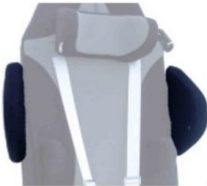
Soportes de hombro Kidsflex