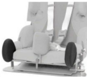
Soporte de pierna Kidsflex