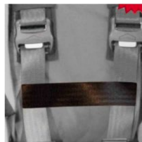
Cinturón conexión cinchas pecho Hernik