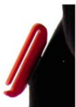
Guía de cinturón adicional Kidsflex