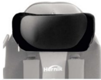
Soporte de cabezas Kidsflex