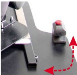
Base giratòria Starlight-Nxt