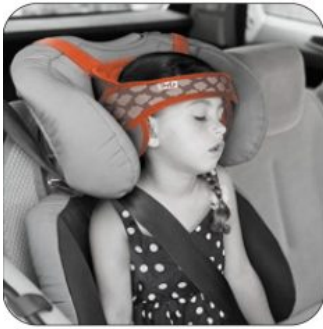
Fixació per al cap Ipai-NXT