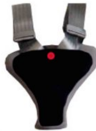
Protector de seguretat Hernik