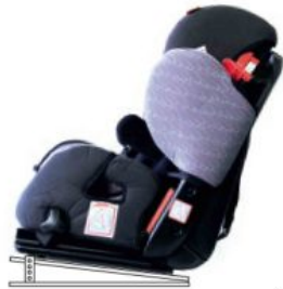
Base basculació extra Starlight-Nxt