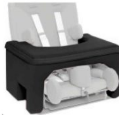
Taula de seguretat Starlight-Nxt