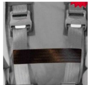
Cinturó coneixió cinxes pit Hernik