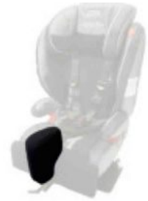
Tac abductor extríble Starlight-Nxt