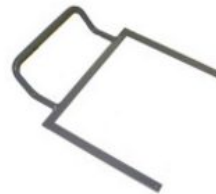
Arc d'estabilització Starlight-Nxt