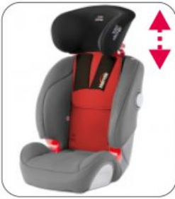
Kit XL Starlight-Nxt