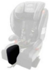
Taco abductor extraíble Starlight-Nxt