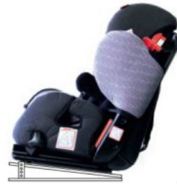
Base ajustable en inclinación Starlight-Nxt