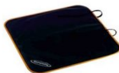
Protector asiento de coche Hernik