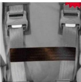
Cinturón conexión cinchas pecho Hernik