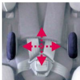
Soportes laterales Starlight-Nxt