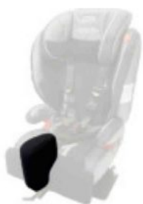
Taco abductor extraíble Starlight-Nxt