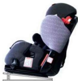
Base ajustable en inclinación Starlight-Nxt