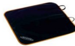
Protector asiento de coche Hernik