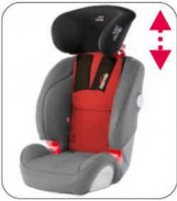
Kit XL Starlight-Nxt