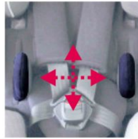
Soportes laterales Starlight-Nxt