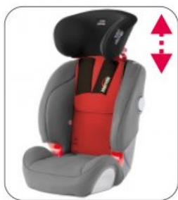
Kit XL Starlight-Nxt