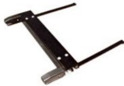
Adaptador Isofix Hernik