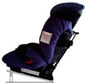
Base ajustable en inclinación Ispai-Nxt