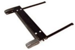
Adaptador Isofix Hernik