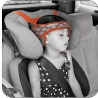
Fijación para la cabeza Hernik