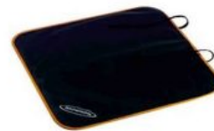
Protector asiento de coche Hernik