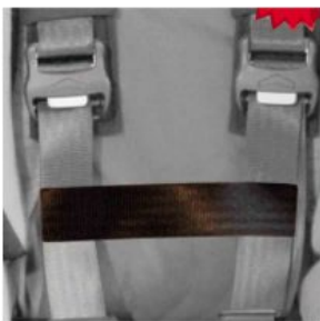
Cinturón conexión cinchas pecho HERNIK