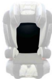
Cojines reductores asiento Ispai- Nxt