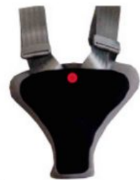
Protector de seguridad Hernik