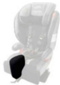
Taco abductor extraíble Ipai-Nxt